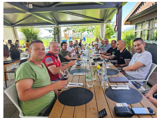
Expertenschulung für die eidg. Berufsprüfung FM Wärmesysteme der Tessiner in Colombier NE.