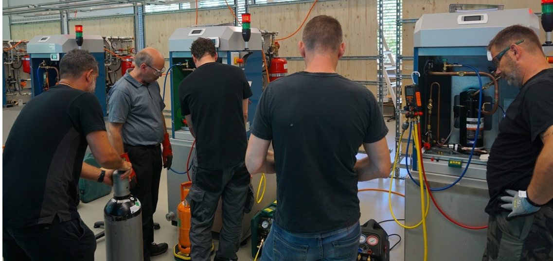
Participants et participantes au cours «Pompes à chaleur» destiné aux personnes venant d'autres secteurs à l'École technique suisse de Winterthour (STFW).