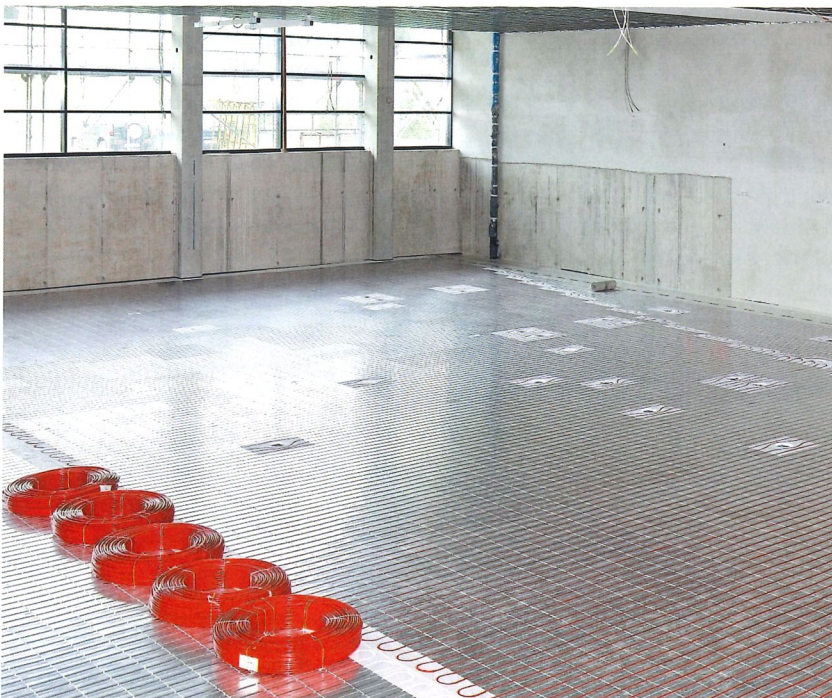
Auch für Turnhallen sind Flächenheizungen ideal, schliesslich soll der Boden so elastisch wie möglich bleiben.

Einen wesentlichen Nachteil haben Industrieflächenheizungen dennoch: Durch die Verlegung direkt im Betonkern sind sie praktisch nur im Neubau umsetzbar. In bestehenden Bauten hingegen empfiehlt es sich, mit Deckenstrahlsystemen zu arbeiten. Auch sie bieten flexible Raumnutzung, einfache Installation, konstante Temperatur und kostengünstigen Betrieb. Konkret werden bei Deckenstrahlsystemen Heizungsrohre an der Decke montiert. Festgemacht an vorhandenen Strahlträgern oder dann direkt am Beton. Natürlich nicht die nackten Rohre. Vielmehr Platten, auf oder in denen die Heizungsrohre zu liegen kommen. «Vereinfacht gesagt sind dies schlicht modulare Stecksysteme, fertig aufgebaut und gedämmt, in Länge und Breite praktisch frei variierbar», erklärt Rolf Ulmann, Verkaufsleiter bei Zehnder Group Schweiz. Dadurch können sie passgenau auf jene Flächen abgestimmt werden, die auch wirklich beheizt werden sollen. Oder gekühlt: Denn selbstverständlich bieten auch Deckenstrahlsysteme Kühlen und Heizen in einem. Vor allem aber reagieren sie enorm schnell, die Heiz- oder Kühlwirkung ist quasi umgehend spürbar. Und dies trotz ebenfalls tiefer Vorlauftemperaturen. Zu verdanken ist dies dem Prinzip der Strahlungswärme, vergleichbar mit der Sonne von oben: «Die Energie überträgt sich enorm schnell. Aber erst, wenn die