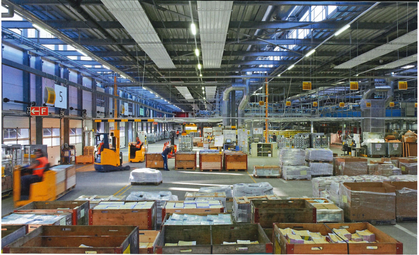
Bei Deckenstrahlsystemen werden Platten an der Decke montiert, in denen Heizungsrohre zu liegen kommen.

Im Gegensatz zu einer konventionellen Bodenheizung, die nur den Boden heizt, aktiviert eine Industrieflächenheizung ganze Bauteile thermisch. Dies schränkt zwar die Reaktionsfähigkeit etwas ein, was bei Industrie- oder Gewerbehallen jedoch kaum ins Gewicht fällt. Dafür profitiert man von der enormen Speicherfähigkeit: Die Wärme bleibt auch im Bauteil, wenn einmal Durchzug herrscht. Entsprechend reichen Vorlauftemperaturen von unter