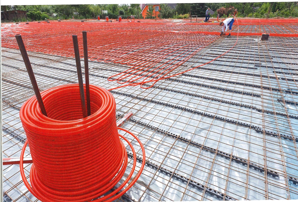
Bei Industrieflächenheizungen kommen die Heizrohre direkt in den Betonkern und wärmen oder kühlen von dort anschliessend das gesamte Bauteil.

Vertriebs AG und Mitglied der Fachgruppe Wärmeverteilung von GebäudeKlima Schweiz. «Zudem muss eine Heizung einfach installiert werden können, eine konstante Temperatur liefern ohne Zugluft und kostengünstig sein im Betrieb. All dies lässt sich mit einer Industrieflächenheizung realisieren.» Tatsächlich lassen sich die Heizkreise nicht nur günstig einbringen, sondern vor allem auch flexibel auf die Gebäudegeometrie anpassen. Vor allem, wenn die Heizungsrohre direkt vor Ort in den Betonkern verlegt werden. Daneben gibt es auch die Option, vorgefertigte Netze mit Heizkreis-Modulen auf der Baustelle einzubringen oder aber besonders zeiteffizient mit Betonfertigelementen zu bauen, in welche die Heizungsrohre bereits verlegt sind.