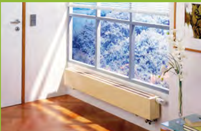
Konvektoren erfüllen einen wichtigen Zweck, besonders vor Fenstern oder vor Brüstungen.