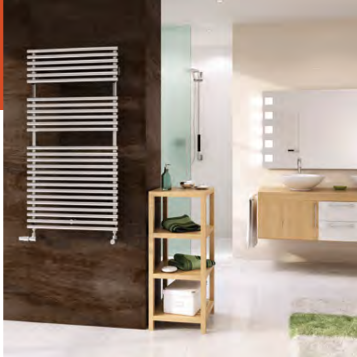
Heizkörper dienen im Badezimmerbereich der Komfortsteigerung. Warmes Handtuch, schnelle Wärme im Raum, angenehme Strahlungswärme und dekorativer Effekt in einem.