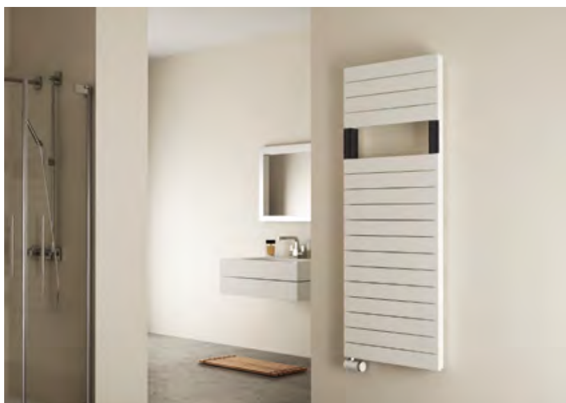
Vereinigung von individuellem Design und Leistung zeigt diese Elektroausführung. In sanierten Bädern ist oftmals kein Anschluss an die bestehende Wärmeverteilung vorhanden.

körper und Handtuchrockner: Deren Form und Farbgebung muss stimmig sein und mit einem gegebenen stilistischen Konzept von Möbeln, Geräten und Armaturen harmonisieren – als ästhetisch gleichwertiges Element anspruchsvoller Innenarchitektur.