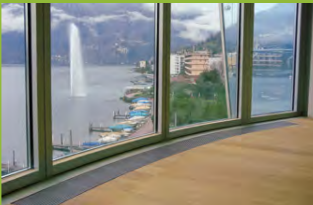
Unterflurkonvektoren erfüllen einen hohen optischen Anspruch und können Funktionen wie heizen, lüften oder kühlen übernehmen.

Auf dem Schweizer Markt gibt es eine Vielzahl an Möglichkeiten, welche wie geschaffen sind für modernes Bauen und offene Architektur. Solche Lösungen können in Ausstellungen und Referenzobjekten angesehen werden.