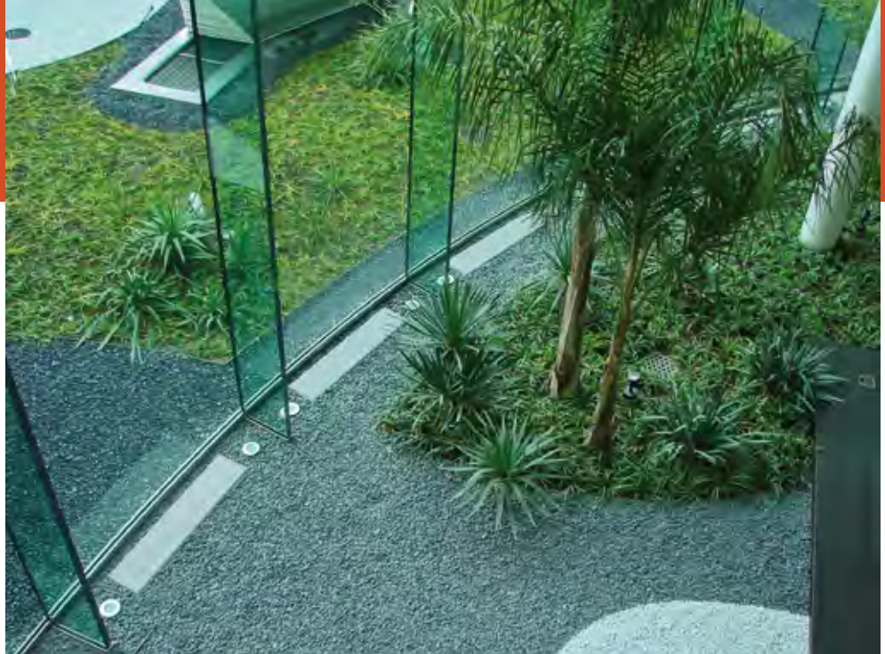
Unterflurkonvektoren werden meist als Sonderlösungen gefertigt, wie hier in einer Empfangshalle eines Geschäftshauses im Tessin.

Unterflur- konvektoren: Dezent und nahe- zu unsichtbar.