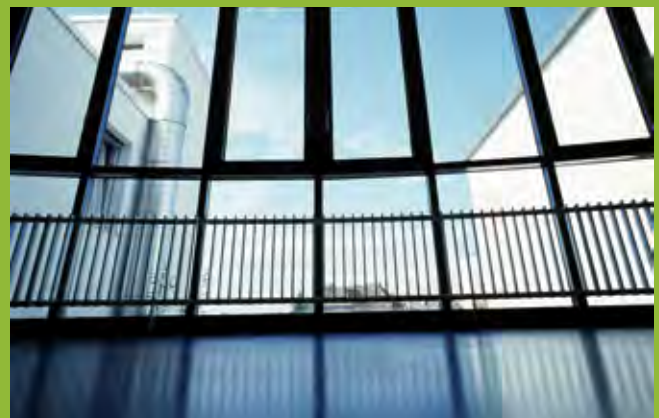
Filigran und dennoch solid: Flachrohrradiatoren in einem typischen Einsatzgebiet. Ideal für grosse Fensterflächen – und für tiefe Systemtemperaturen.