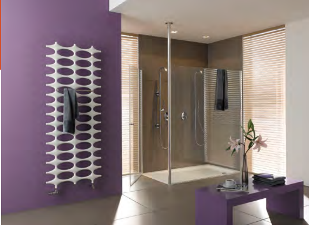
Spezielles und ungewöhnliches Wärme-Design eines renomierten Anbieters von Heizkörpern.

Moderne Heizkörper: einst Zweckobjekt. Heute auch interessantes Gestaltungselement.