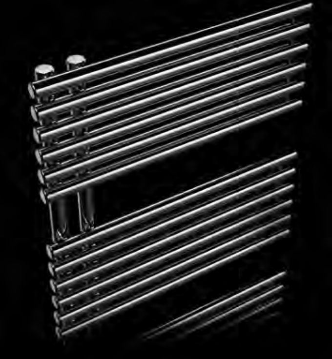
Chromstahl ist eine edle Oberfläche, welche dem Heizkörper im modernen Bad ein sehr edles und dekoratives Erscheinungsbild verleiht.