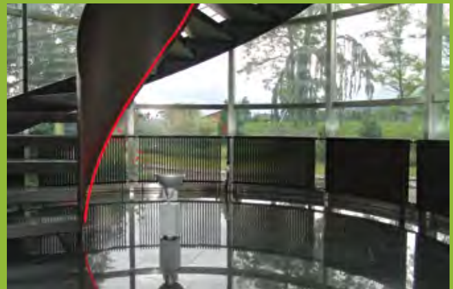
Transparenz und Klarheit spielen bei Heizkörpern vor Glas eine wesentliche Rolle.